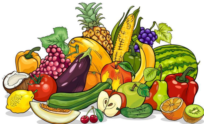
Монахини разложили на столе разные фрукты и овощи. Найди 10 отличий